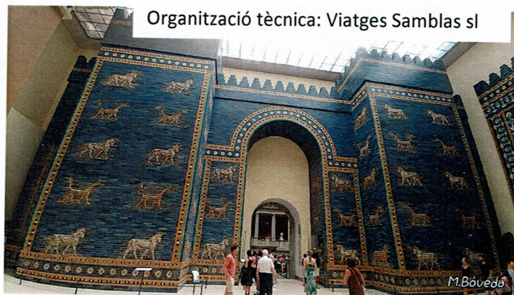
Organització tècnica: Viatges Samblas sl

Esmorzar a l'hotel. Durant el dia d'avui ,Continuarem amb la visita a la ciutat amb el guia local . Visita al Tergarten, un dels pulmons de la ciutat, el barri Jueu, Dinar i a la tarda, ens dirigirem a la illa dels Museus on realitzarem l'entrada al espectacular museu del Pérgamo on podrem admirar més de 270.000 objectes provinents de les grans excavacions realitzades a Babilònia. A la planta superior del Museu de Pèrgam s'hi ubiquen les obres de l'antic Art Islàmic, una mostra d'artesanía dels països islàmics des del segle VIII al XIX. A l'hora indicada trasllat a l'aeroport per agafar el vol directe cap a Barcelona. Arribada i trasllat amb autocar al nostre punt d'origen. Arribada, fi del viatge i dels nostres serveis.