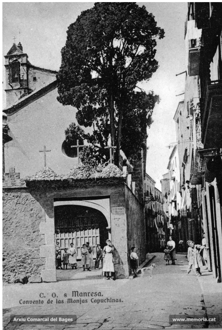
C. O. s Manresa. Convento de las Monjas Capuchinas.